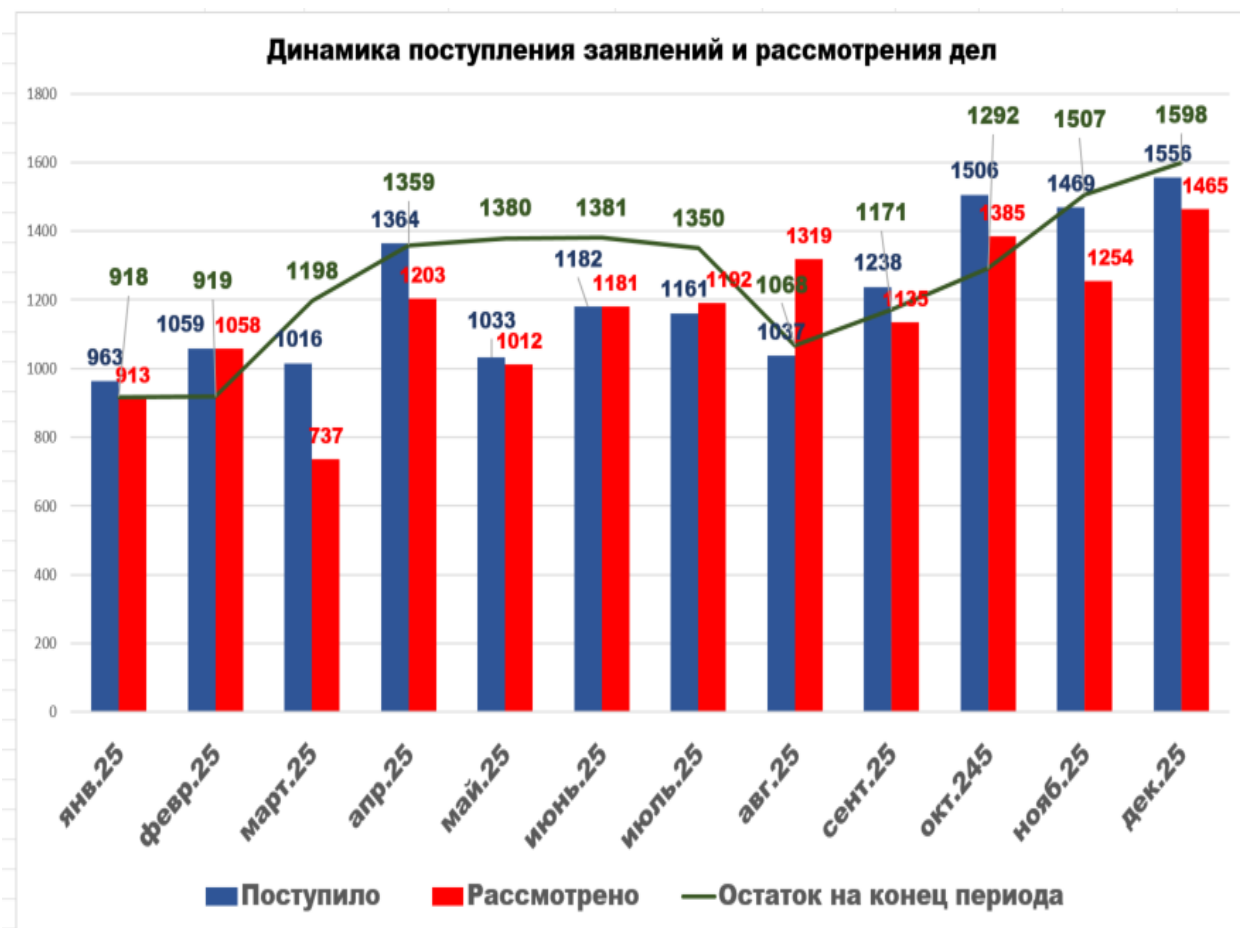
Количество поступивших дел за год