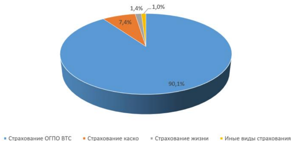
Доля поступивших заявлений в разрезе классов страхования

Доля поступивших заявлений в разрезе видов страхования в 2025 году: